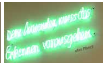
A report on the ESPE conference will be published in the next edition of the SOEPnewsletter in October 2016