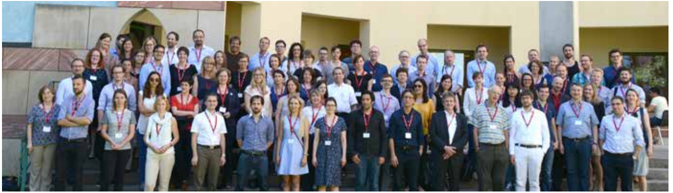
SOEP 2016 conference

injustice is a risk factor for stress-related diseases. In times of rising inequalities, her findings make a valuable empirical contribution to the public and scientific debate.