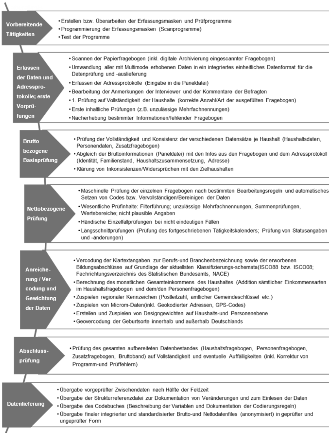
Abbildung 5.1: Die sieben Prozessschritte der Datenverarbeitung und -aufbereitung im SOEP